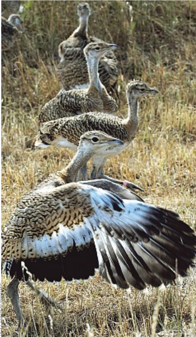
Keine Windrad-Fans: Trappen gelten als sehr störungsempfindlich